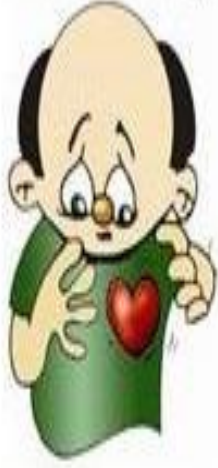
Hızlı Kalp Atışı